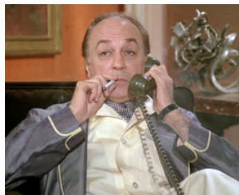
1979 L'ANNÉE SAINTE de Jean Girault