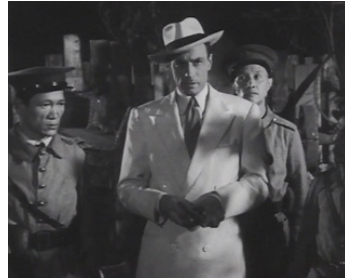
1950 MYSTÈRE À SHANGHAÏ de Roger Blanc