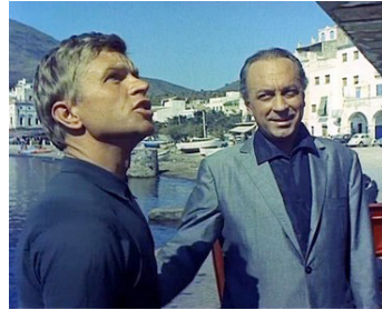
1965 LES PIANOS MÉCANIQUES (Los Pianos mecánicos) de J. A. Bardem avec Hardy Krüger