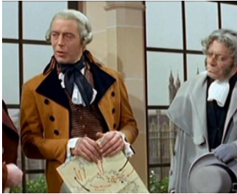
1960 AUSTERLITZ d'Abel Gance avec Maurice Escande