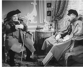
1948 LE DIABLE BOÎTEUX de Sacha Guitry avec Henry Laverne