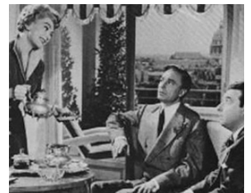
1956 LE 7 e COMMANDEMENT de Raymond Bernard avec Edwige Feuillère, Jacques Morel