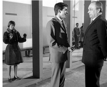
1962 LE PROCÈS (The Trial) d'Orson Welles avec Anthony Perkins