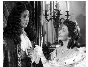
1953 SI VERSAILLES M'ÉTAIT CONTÉ de Sacha Guitry avec Claudette Colbert