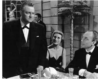
1960 DRAME DANS UN MIROIR (Crack in the Mirror) de R. Fleischer avec Orson Welles