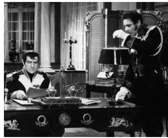
1942 LE DESTIN FABULEUX DE DÉSIRÉE CLARY de et avec Sacha Guitry