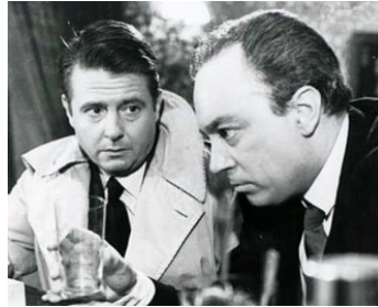
1960 LA MORT DE BELLE d'Édouard Molinaro avec Jean Desailly