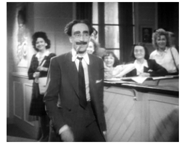
1945 SÉRÉNADE AUX NUAGES d'André Cayatte