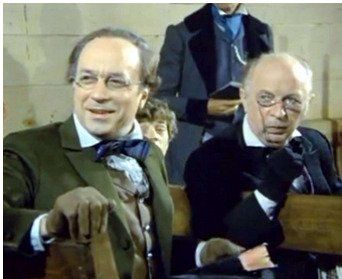
1969 LES AV. DE TOM SAWYER ET HUCKLEBERRY FINN de Wolfgang Liebeneiner avec R. Amontel