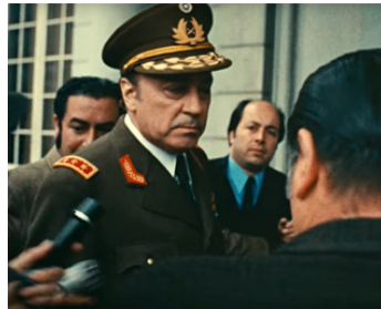
1973 ÉTAT DE SIÈGE de Costa-Gavras