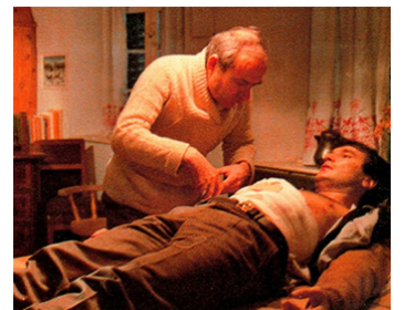
1981 IL FAUT TUER BIRGITT HAAS de Laurent Heynemann avec Christian Bouillette