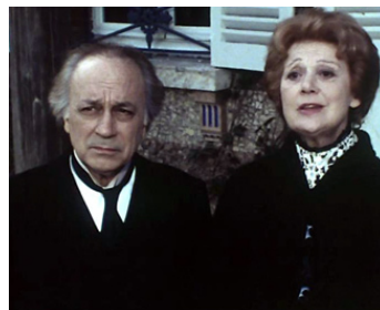
1979 LES DAMES DE LA CÔTE de Nina Companeez avec Edwige Fueillère