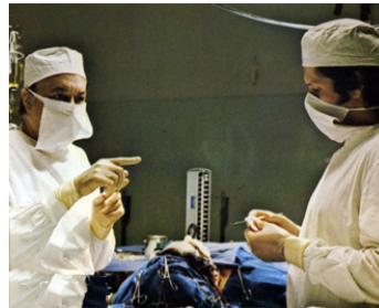
1973 NOCES DE CENDRES (Ash Wednesday) de Larry Peerce avec Elizabeth Taylor