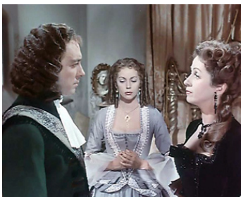
1955 L'AFFAIRE DES POISONS d'Henri Decoin avec Anne Vernon, Danielle Darrieux