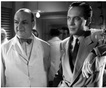
1941 LE PAVILLON BRÛLE de Jacques de Baroncelli avec Pierre Renoir