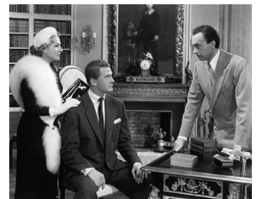
1954 BOULEVARD DE PARIS (Bedevilled) de M. Leisen avec Simone Renant, Steve Forrest