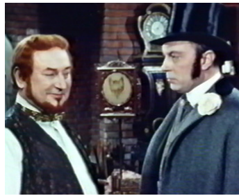
1957 SANS FAMILLE d'André Michel avec Pierre Brasseur