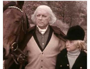
1973 LE NEVEU D'AMÉRIQUE de Pierre Gaspard-Huit avec Marc Di Napoli