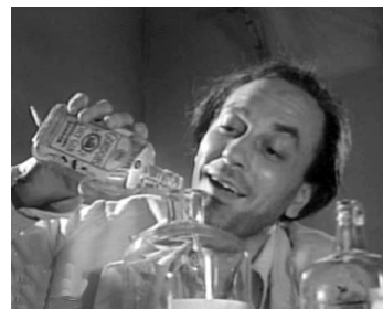
1954 LA SOUPE À LA GRIMACE de Jean Sacha