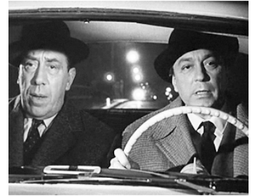
1961 L'ASSASSIN EST DANS L'ANNUAIRE de Léo Joannon avec Fernandel