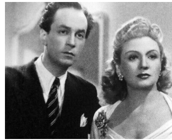
1943 DONNE-MOI TES YEUX de Sacha Guitry avec Geneviève Guitry