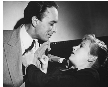
1953 ILLUSION (Illusion in Moll) de Rudolf Jugert avec Hildegard Knef