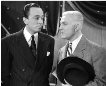
1951 BRELAN D'AS d'Henri Verneuil avec Raymond Rouleau