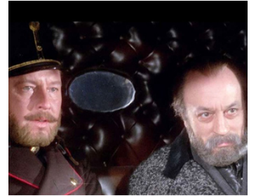
1968 MAYERLING (Mayerling) de Terence Young avec Ivan Desny