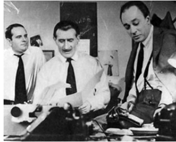
1964 SURSIS POUR UN ESPION de Jean Maley avec Noël Roquevert