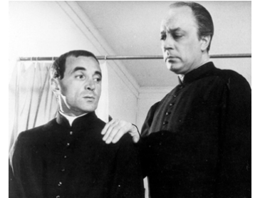
1962 LE DIABLE ET LES 10 COMMANDEMENTS de Julien Duvivier avec Charles Aznavour